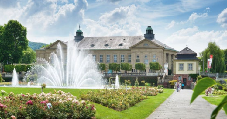
Parkplatz Tattersaal um 14.00 Uhr, Rückkehr ca. 17.30 Uhr