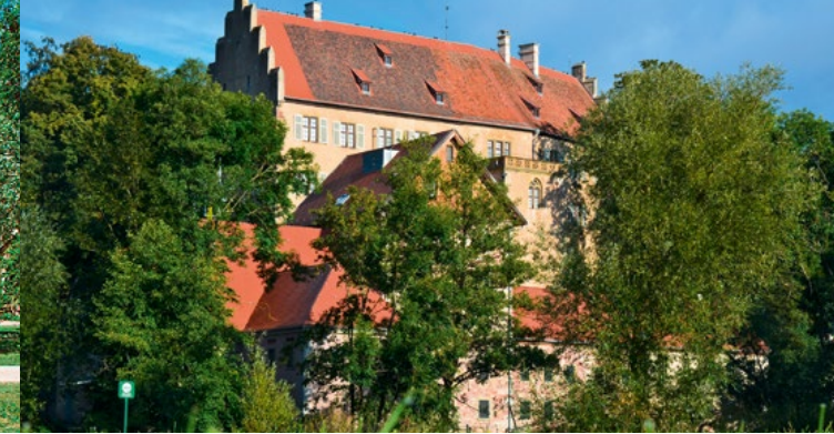
• Donnerstag, Freitag & Samstag: Ankunft ca. 15.00 Uhr, Rückfahrt ca. 16.30 Uhr