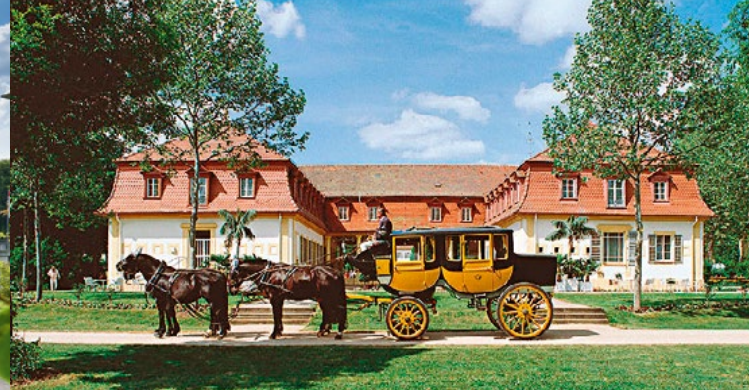
• Sonntag: Ankunft ca. 15.00 Uhr, Rückfahrt ca. 16.30 Uhr