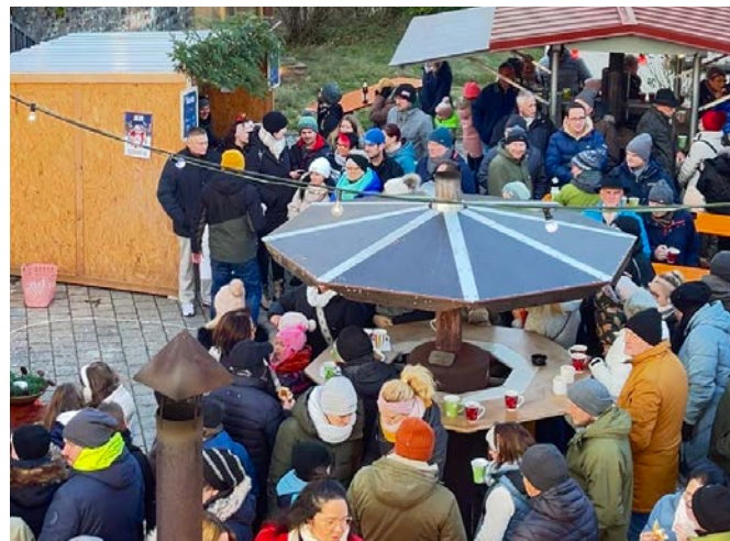
Der Adventszauber in Steinach war auch dieses Jahr wieder gut besucht.