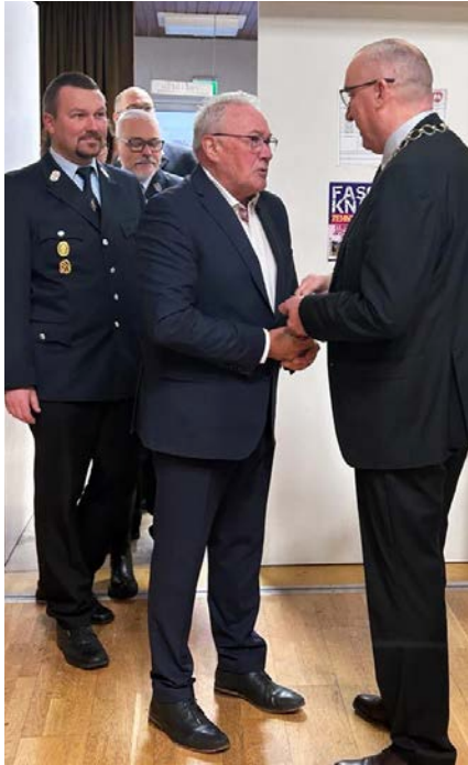
links: Bürgermeister Andreas Sandwall begrüßt die Gäste zum Neujahrsempfang in der Zehnthalle in Aschach.