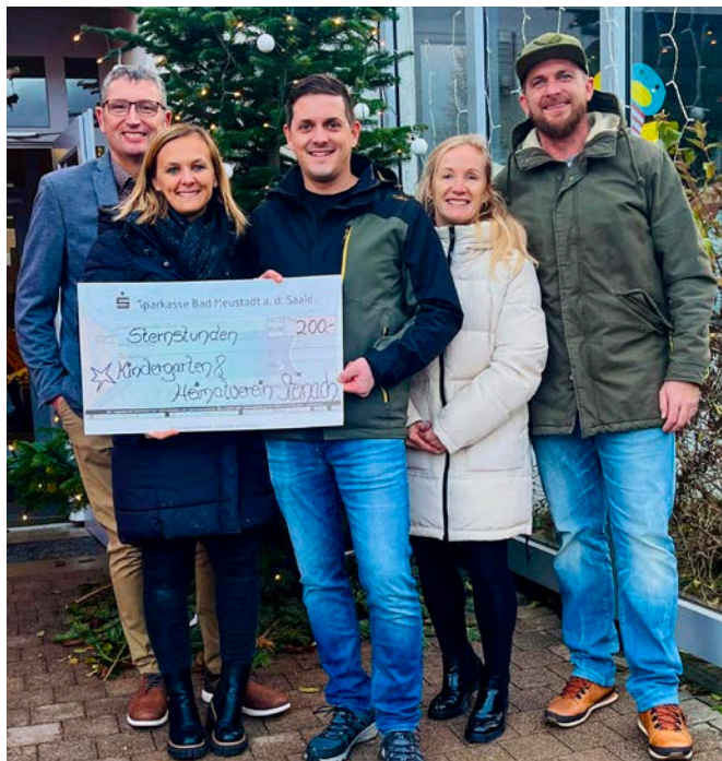
Bei der Spendenübergabe – von links: